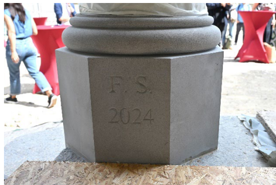
Cette base, reproduite à l'identique de l'originale, arbore symboliquement les lettres « F. S. », qui signifient fac-similé, suivies de « 2024 », l'année de la réalisation du gros-œuvre de ce chantier