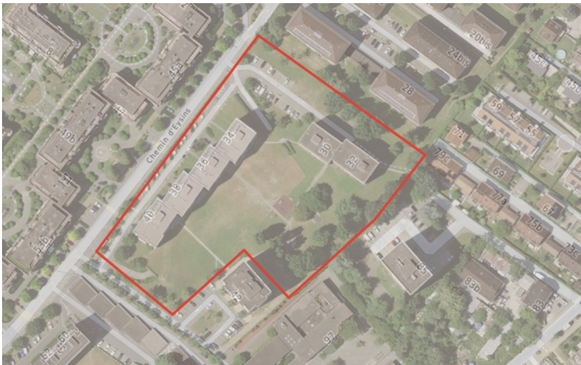
Figure 1 - Site des Jouvencelles (localisations des potagers à préciser avec les propriétaires)

En tant que premières phases d'extension en vue du doublement de la surface des jardins potagers de la Ville, les phases d'étude et de réalisation pour l'aménagement du jardin potager sur le site des Jouvencelles pour une surface d'environ 800m 2 ont été estimées à CHF 115'000.– (voir chapitre Incidences financières).